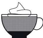
BELA KAVA S SMETANO 2×kava 7×mleko 2×smetana