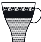
LATTE MACCHIATO 5×mleko 2×kava 1×penjeno mleko